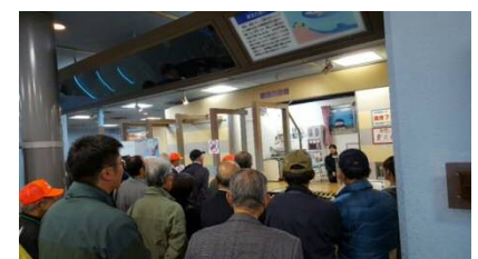
11月 視察研修（名古屋市港防災センター）